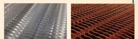
Before Coated After Coated & Curing

Aeriscoat R สารก้ำกัจัดและป้องกันจุลินทรีย์ไปโอบีฟิล์มและการผูกร้อนได้ในหนึ่งเดียวตามมาตรฐานของ US และ CSR ด้วยประสิทธิภาพยาวนานถึง 5 ปี, ลดความถี่การบำรุงรักษา และใช้ได้กับคอยล์ร้อนและคอยล์เย็นโดยเฉพาะในพื้นที่ที่ลุ่ม ร้อนชื้น ชายทะเล โรงงาน โรงแรม ฯลฯ